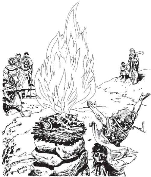
परमेश्वर एलियाकि प्रार्थनाक जवाब दिणई

तब एलियाल सब मैसों धैं कौ, "म्यर पास आओ।" यैक लिजी सब मैस वीक सामण आई, और वील इस्रायलक गोत्रोंक गिनतील बार ढुड लिबेर परमेश्वरक वेदी कैं, जो पैली टोड़ि रॉखछी, उकैं दुबार बणा। फिर वील वीक चारों तरफ गड्ड खोदौ। और वेदी मिं लाकाँड़ लगैबेर वीक माथि मिं बलदक टुकुड़ बणैबेर धरीं। फिर वील उनुधैं कौ, "तुम चार घड़ पाणि भरिबेर वेदी मिं खिति दिया।" जब उनुल पाणि खिति हैछी, एलियाल उनुधैं फिर कौ, "दुबार खितो।" इसिक वील उनुधैं तीन बार पाणि खितवा। तब वेदीक चारों तरफ पाणि-पाणि है गोय, और वील गड्ड कैं लै पाणिल भर दे।