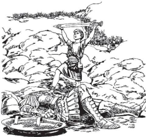
दाउद गोलयत कै मारणौ

जब उ पलिशती दाउदक तरफ उण लागौ, तब दाउद लै वीक तरफ दौड़ौ, और वील आपण झव्ल मिं हात खितौ और हातल एक ढुड निकालिबेर उकें गोफन मिं धरिबेर जोर-जोरल रिडै-रिडैबेर पलिशितयक बरमाँण मिं मारौ, जैल उ वीक कपाव मिं बुड़ गोय, और उ मुखक बल धड़ाम कै लफाई गोय। और दाउद दौड़बेर गो और वीकी तलवार निकालिबेर गव काटिबेर उकें मारि दे। इसिक दाउदल गोफन और नाँनू ढुडल पलिशती कै हरै दे, जबकि वीक पास तलवार लै नि छी।