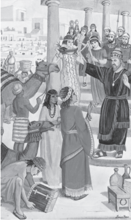
शेबाक रानी और सुलेमानक भेट

जब शेबा देशकि रानील सुलेमानकि बढ़ाई सुणी, तब उ आपण मुश्किल-मुश्किल सवालों कै लिबेर वीक परीक्षा करणक लिजी ऐ। उ आपण दगाड़ दरबारियों, सैप, दास-दासियों कै मश्याल, सुन और म्हैंग मणियोंल लादी ऊंटों कै लिबेर यरुशलेम ऐ। जब वील सुलेमान रॉज धै आपण सब सवाल पुछीं, तब सुलेमानल वीक सब सवालोक जबाब दे, और क्वे लै यस सवाल नि छी जैक जवाब उ नि दी सक। जब शेबाक रानील सुलेमानक बुद्धिमानी समझी, वीक दरबारियोंक ठाट-बाँट देखौ, उ महलक खाँण खा, वीक कर्मचारियोंक काम-धाम और उनर लुकुड़ देखीं, और वीक बणवाई भवन कै देखौ, और उ बलिदान जो उ चढ़ूछी, यौ सब देखिबेर उ हक