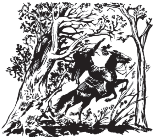
हाडक बीच मिं अबशालोम

मरि पड़ी। और दाउद रॉजॉक सिपैनोंल अबशालोमक सिपैनों कैं हरैबेर खिदाड़ दे। और उ दिन बीस हजार सिपै मरि ग्याय। अबशालोम लै आपण जान बचूणक लिजी खेच्चर मिं भैबेर भाजणौछी, और उ खेच्चर एक ठुलौ बांजक बोटक हाडक ताव बे गो, जैल अबशालोमक ख्वर उ हाड मिं अटक गोय। और उ बोट और धरतिक बीच मिं लटकी रै गोय।